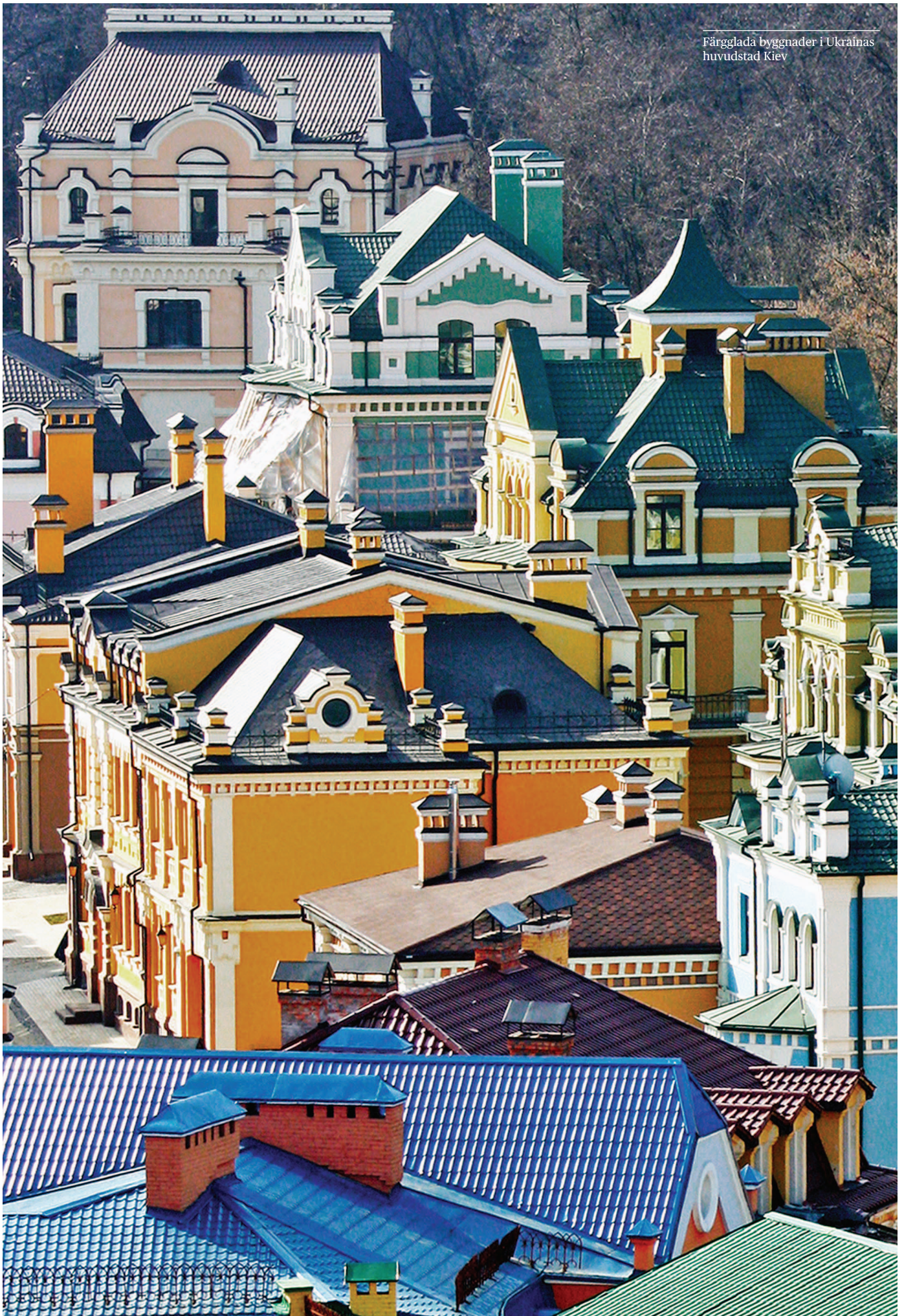
Färgglada byggnader i Ukrainas huvudstad Kiev